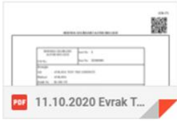
Tablo-18: e-Alındı Belgesi Düzenlenen Kişi veya Tüzel Kişiliğe Gönderilen e-Posta