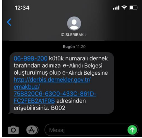
Tablo-16: e-Alındı Belgesi Düzenlenen Kişiy Gönderilen SMS (e-posta bildirilmemişse)

e-Alındı Belgesi düzenlenen kişinin cep telefonuna "06-999-200 kütük numaralı dernek tarafından adınıza düzenlenen e-Alındı Belgesine https://derbis.dernekler.gov.tr/... adresinden ulaşabilirsiniz." mesajı gönderilir. Mesaj metninde yer alan linke tıklanarak DERBİS tarafından oluşturulan e-Alındı Belgesi görüntülenebilmektedir.