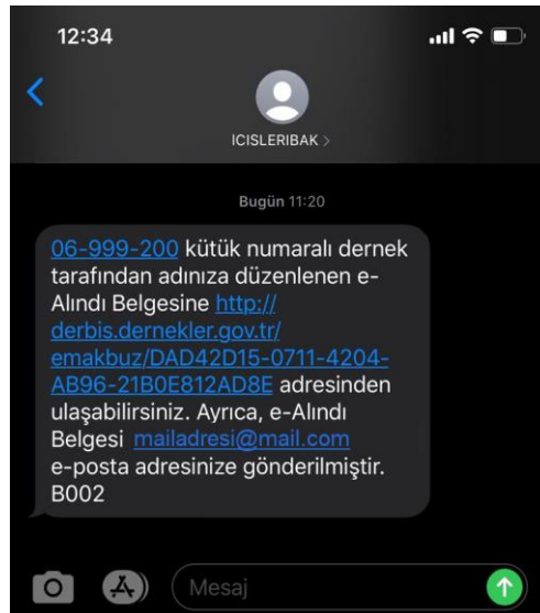
Tablo-17: e-Alındı Belgesi Düzenlenen Kişiy Gönderilen SMS (e-posta bildirilmişse)

e-Alındı Belgesi düzenlenen kişinin cep telefonuna "06-999-200 kütük numaralı dernek tarafından adınıza düzenlenen e-Alındı Belgesine https://derbis.dernekler.gov.tr/... adresinden ulaşabilirsiniz. Ayrıca, e-Alındı Belgesi mailadres@mail.com e-posta adresinize gönderilmiştir." mesajı gönderilir. Mesaj metninde yer alan linke tıklanarak DERBİS tarafından oluşturulan e-Alındı Belgesi görüntülenebilmekte olup aynı zamanda kişinin beyan etmiş olduğu e-posta adresine e-posta gönderilmiştir.